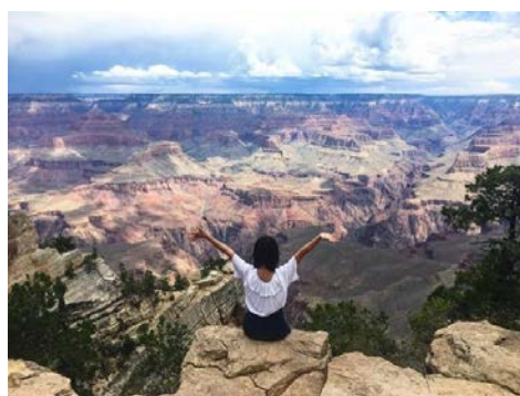
グランドキャニオン