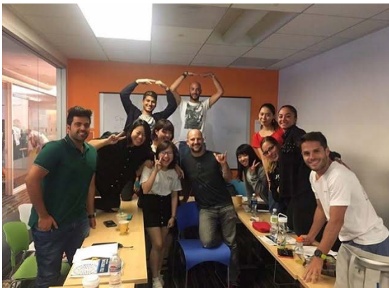
授業終わりの様子

EC 語学学校はクラス分けされていて、自分のレベルに合った授業が受けられます。また EC は学校全体の生徒数が多いので、世界中から集まった様々な人種の人と知り合うことができました。また、学校の生徒と話すことで、今まで知らなかった様々な文化を知ることができました。先生はとても親切で、分からないことを最後まで丁寧に教えてくれました。ルールがあまりなく、授業は和やかな雰囲気で行われました。発言もしやすく、英語を楽しむことができる環境でした。また、スピーキングが中心の授業だったので実用的な英語が身につきました。学校の場所はサンタモニカの中心にあり、ロスの中では治安がとてもよいです。学校からすぐの所にサードストリートという通りがあり、レストランやお店がたくさんあるので、放課後や休み時間にランチやショッピングを楽しみました。ビーチまでも近いので、放課後に気軽に遊びに行けて、学校の生徒と交流を深めることができました。