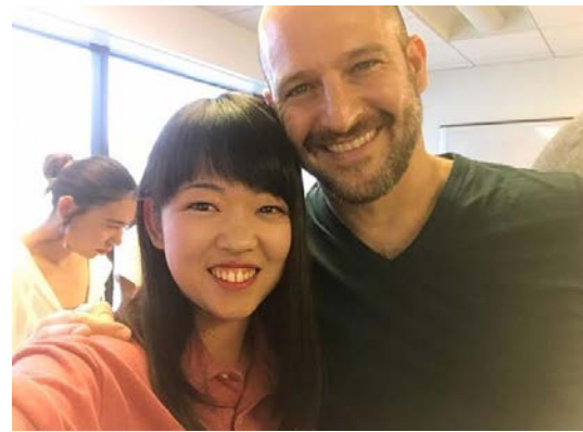
担任の先生のタッド