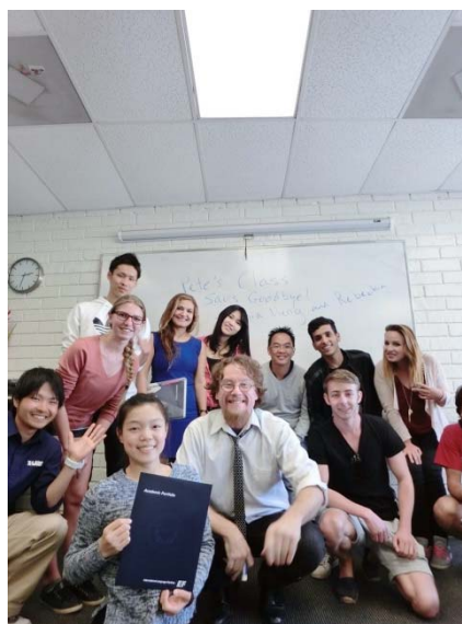
Figure 1 My classmate